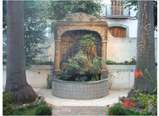
Cascada i safareig de can Bisa al carrer Bartrina

La història d'aquests safareigs, construïts a les eixides de les cases de cós, està íntimament lligada a la història de l'arribada d'aigua corrent al poble. La Mina Vella i la Mina Nova foren les encarregades del subministrament de tota la població des de mitjans del segle XIX, actualment ambdues mines encara són aprofitades. Vilassar de Mar fou un dels primers pobles en disposar de companyia subministradora i de fet Aigües de la Mina Vella, S C P és una de les més antigues del país. Amb mil cinc-cents socis encara funciona com una comunitat de propietaris que distribueix l'aigua necessària sense afany de lucre. Per tant, les dues mines esmentades, que formaven en origen dues companyies separades però que posteriorment es van unir sota el nom de Mina Vella, foren les responsables de l'aparició de tots els safareigs i cascades que encara es poden veure a la nostra vila.