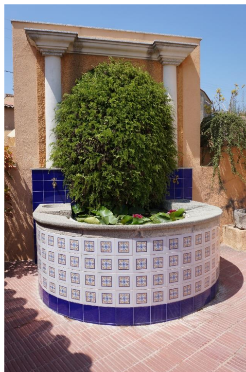
Cascada i safareig del Museu de la Mina Vella, reconstrucció amb peces originals

1 La ploma a Vilassar de Mar eren 8.440 litres/dia